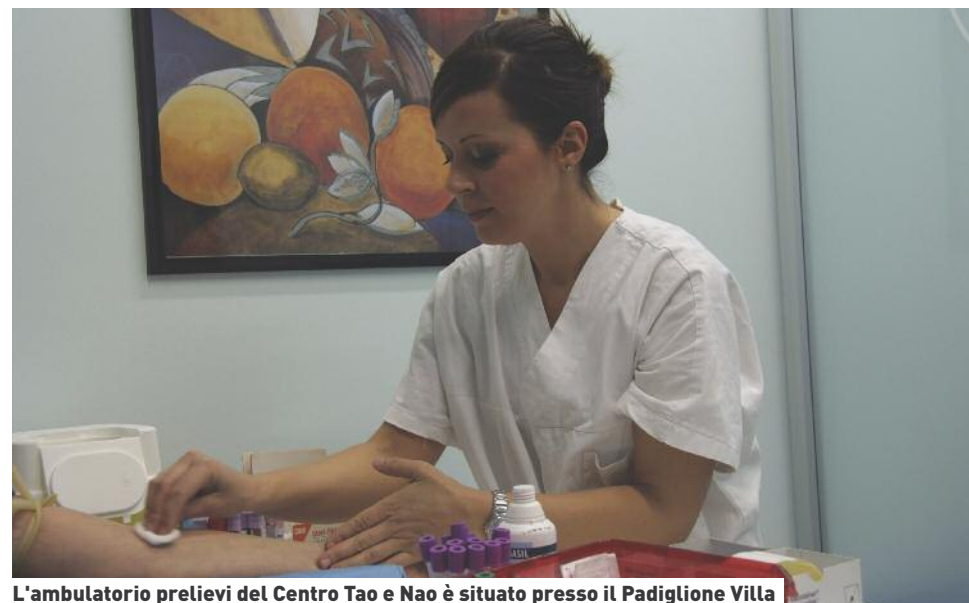
L'ambulatorio prelievi del Centro Tao e Nao è situato presso il Padiglione Villa