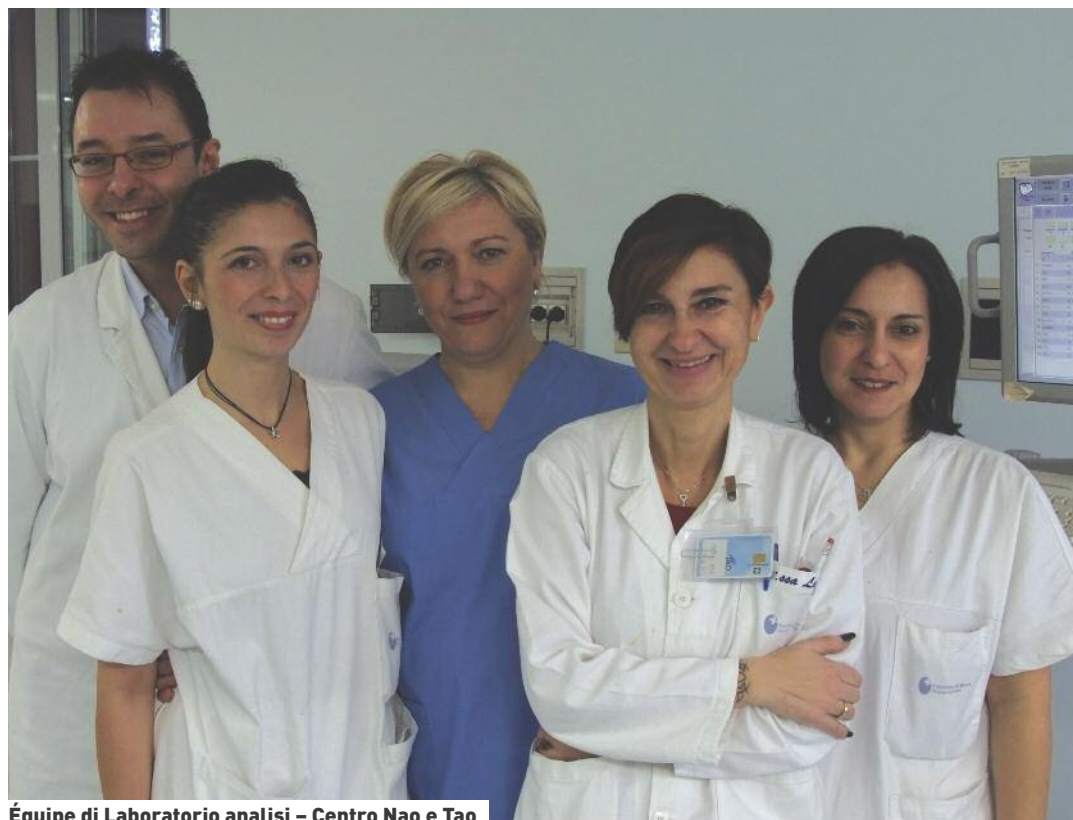
Équipe di Laboratorio analisi – Centro Nao e Tao

Essendo farmaci prescritti con Piano Terapeutico hanno come target principalmente i pazienti con livelli di scoagulazione inadeguata con i farmaci