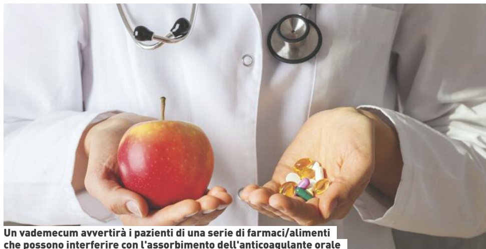
Un vademecum avvertirà i pazienti di una serie di farmaci/alimenti che possono interferire con l'assorbimento dell'anticoagulante orale

Il Servizio TAO consegnerà al Paziente contemporaneamente al primo accesso un Vademecum contenente una serie di farmaci/alimenti che possono interferire con l'assorbimento dell'anticoagulante orale.